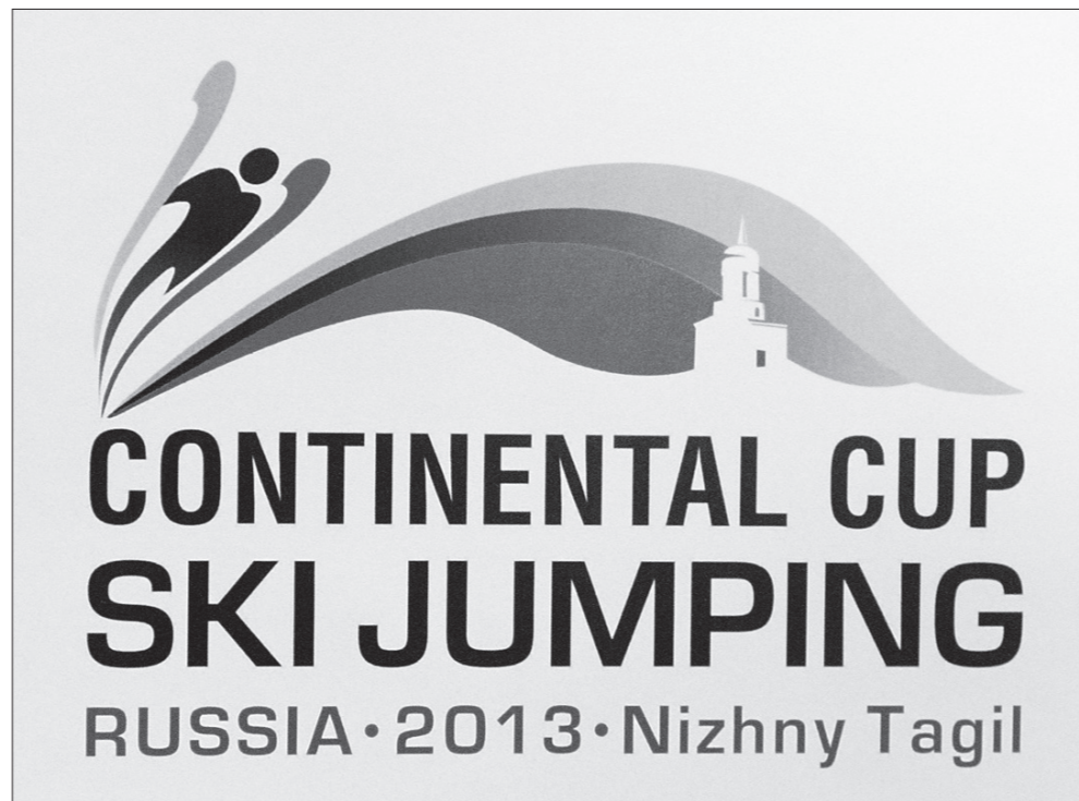
Эмблема этапа Континентального кубка.