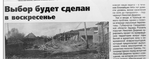
Выбор будет сделан в воскресенье

«Синегорцы сомневаются: станет ли жизнь лучше?» — заголовок статьи из газеты Тагильский рабочий № 11 от 11 октября 2007 года.