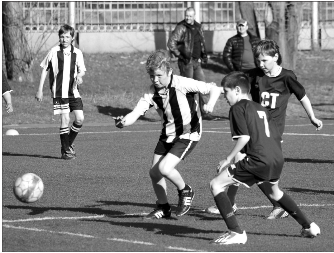
Играют команды школ №64 (в темной форме) и №10.

В честь предстоящего 55-летия школы №64 на искусственном поле стадиона «Юность» прошел турнир по футболу среди учеников 3-4-х классов.