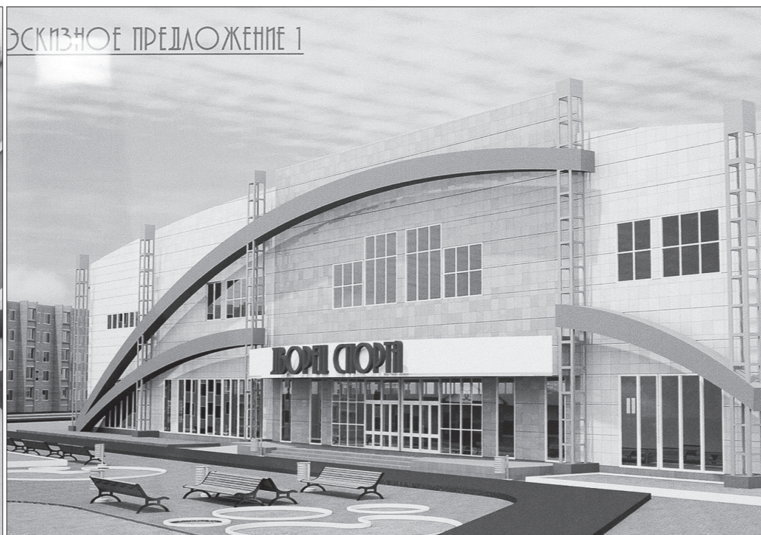
Проект физкультурно-оздоровительного комплекса, представленный ООО «Стиль».

На Гальянке, в Александровском микрорайоне, в скором времени появится новый современный физкультурно-оздоровительный комплекс. Типовые проекты ФОКа, который планируется возвести в рамках программы социального развития города, рассмотрели на совещании с участием главы города Сергея Носова.