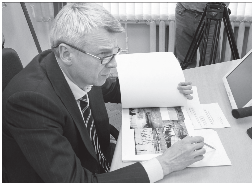
Глава города Сергей Носов.