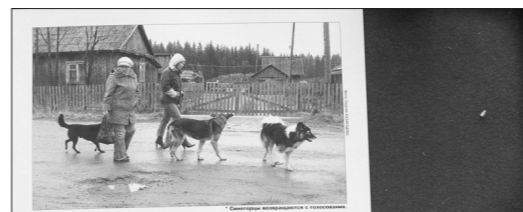
Синегорцы сомневаются: станет ли жизнь лучше?