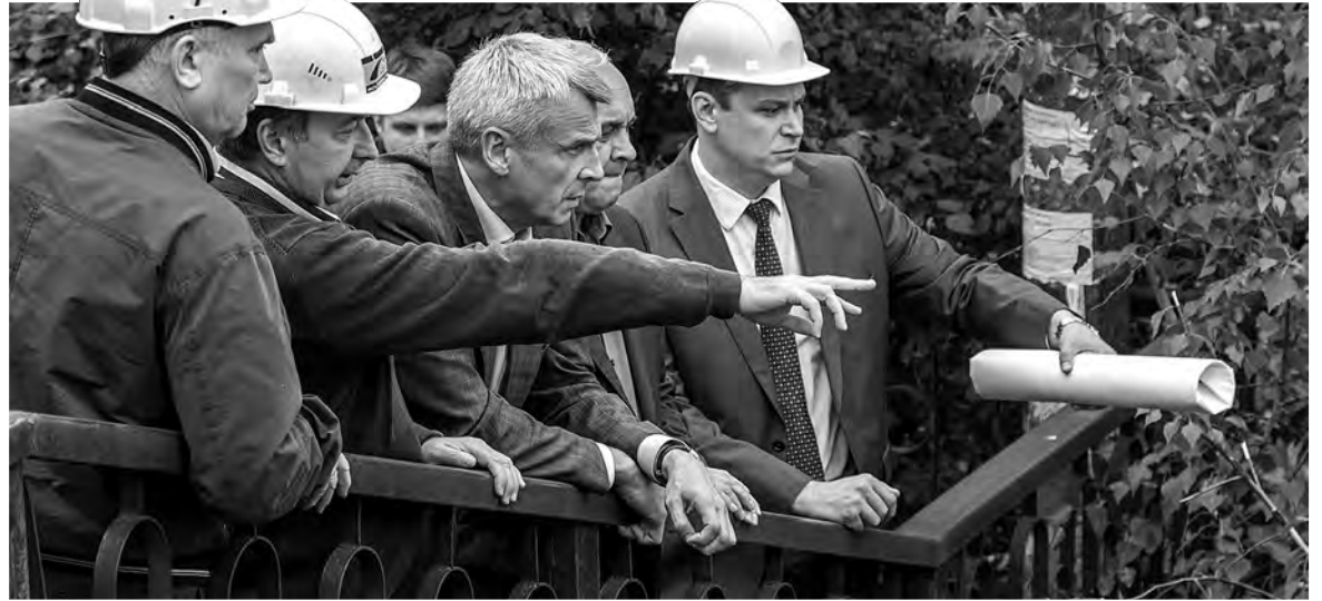
Подрядчики показывают Сергею Носову, где возведут новый мост.

$ 56,83 руб. -1 коп. € 61,69 руб. -23 коп.