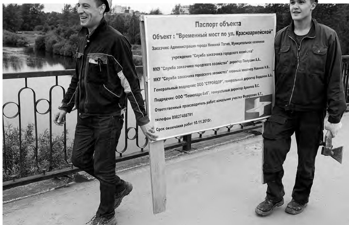
Первым делом строители установили на берегах таблички с паспортом объекта.