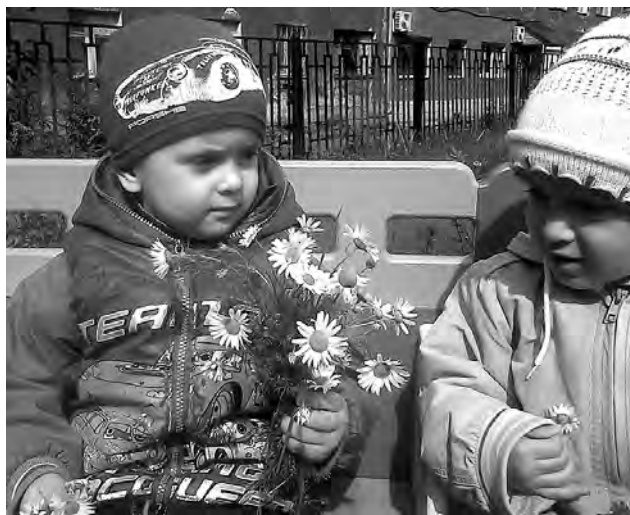
Я тебе нравлюсь? - Ага...

А поскольку детский сад новый и еще не совсем