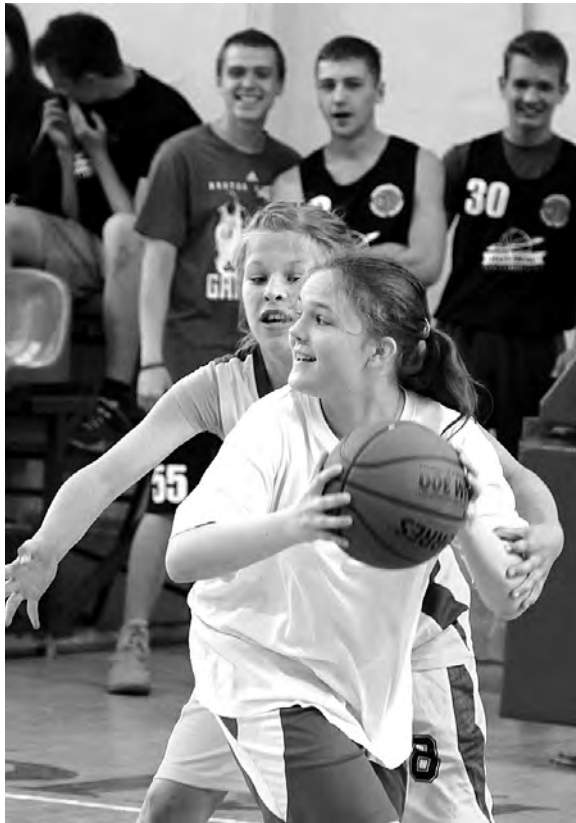
Соревновались и мальчишки, и девчонки.

В пятницу на Пархоменко, 37, прошел кубок «Старого соболя» по стритболу для игроков не старше 18 лет.