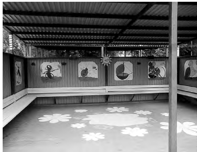
«Сказочная» веранда в новом детском саду.

обжит, всем хочется, чтобы на детских площадках царил уют и комфорт. И благодаря родителям и воспитателям участки для прогулок превращаются в «сказочные». К примеру, на одной из детских веранд поселились добрые и смешные герои сказок детского писателя Виктора Сутеева. А провожают малышей на