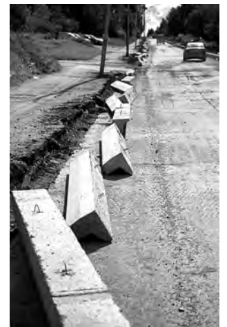
Участок напротив дома №13. По правой стороне бордюры выложены, с левой - возникли проблемы.

Татьяна ШАРЫГИНА.