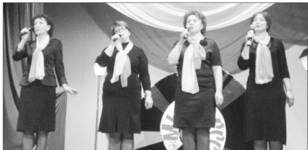
Ансамбль городской больницы № 8

Конферанسه говорили исключительно лозунгами, передавая атмосферу советской эпохи. Например, «Да здравствует советская народная интеллигенция!». Именно её представители и сегодня в авангарде. Врачи, учителя, деятели культуры разнопланово представили своё творчество. Вообще, во время программы жюри и зрители приятно удивлялись, что в нашем городе столько талантли-